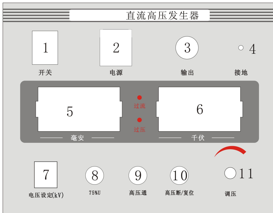
图 2 面板示意图